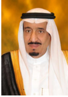
خادم الحرمين الشريفين الملك سلمان بن عبد العزيز آل سعود