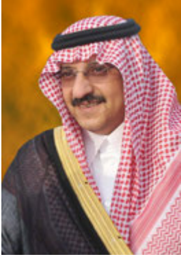
صاحب السمو الملكي الأمير محمد بن نايف بن عبد العزيز آل سعود ولي ولي العهد النائب الثاني لرئيس مجلس الوزراء، وزير الداخلية في المملكة العربية السعودية