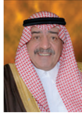
صاحب السمو الملكي الأمير مبرك بن عبد العزيز آل سعود ولي العهد ونائب رئيس مجلس الوزراء