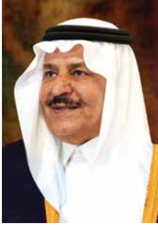
صاحب السمو الملكي الأمير نايف بن عبد العزيز آل سعود ولي العهد ، نائب رئيس مجلس الوزراء وزير الداخلية