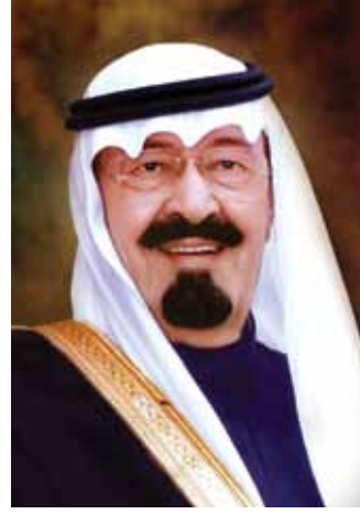
الملك عبد الله بن عبد العزيز آل سعود خادم الحرمين الشريفين